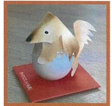
ダックスフント (長毛)