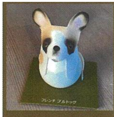
フレンチブルドッグ